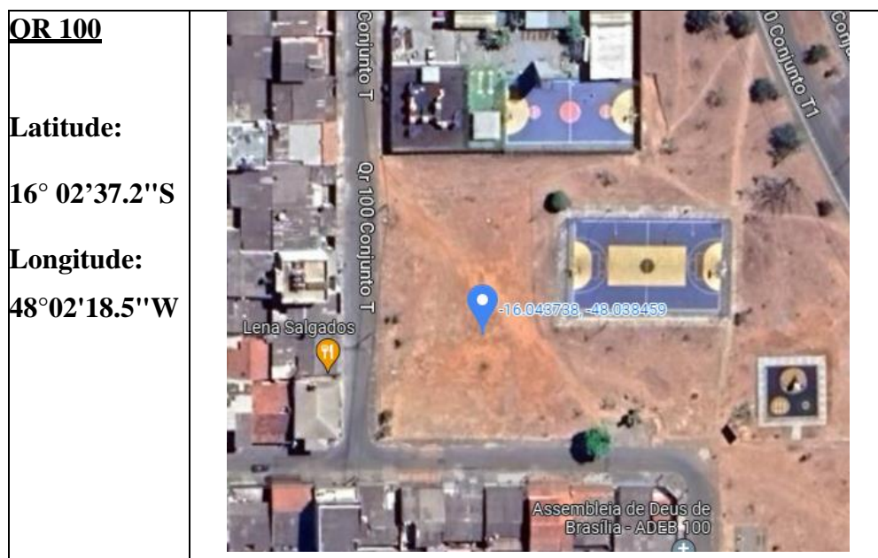
FIGURA 1 - LOCAÇÃO ESTACIONAMENTO NA QR 100, NA REGIÃO DE SANTA MARIA.